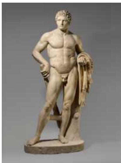
Figura 1 Estátua de mármore de um jovem Hércules Fonte: Robinson, 1906.